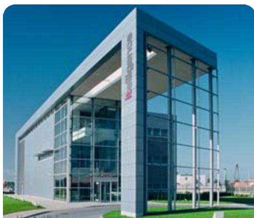
Az itelligence számítóközpontja a lengyelországi Poznanban.

Az itelligence már korán felismerte, hogy a kis- és középvállalatokat egyedi módon kell kezelni, figyelembe véve az iparág egyedi üzleti követelményeit, folyamatait. Számtalanszor bizonyágot tettünk iparági tapasztalatainkról. Ügyfeink így a legfontosabb üzleti tevékenységükkel foglalkozhatnak, miközben mi a mögöttes technológiáról gondoskodunk. Az itelligence számos iparágban fejlesztett ki és vezetett be sikeresen, a standard SAP Business All-in-One megoldáson alapuló, előre konfigurált iparági megoldásokat a kis- és középvállalati szektorban, világszerte.